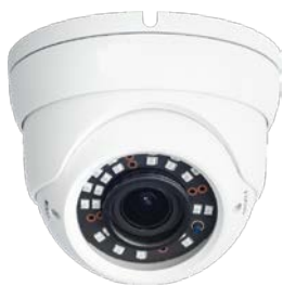
Telecamera multiformato 5MP