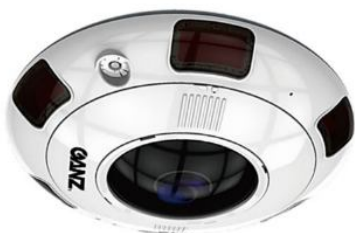
Telecamera Fisheye 12MP