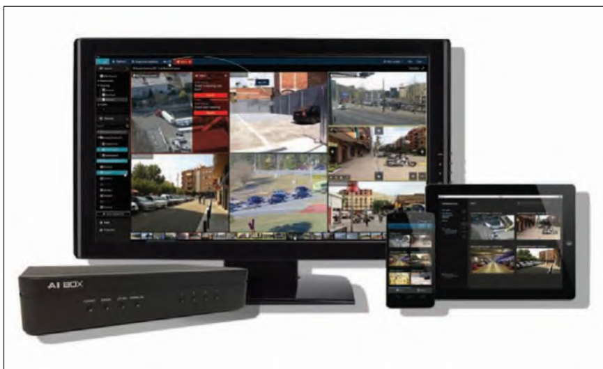
L'I.C. Piersanti Mattarella di Roma si è dotato di un sistema di videosorveglianza firmato GANZ CORTROL e installato da MIB TECH Srl

La soluzione adottata si basa sulla fornitura di telecamere IP e modulo AI-BOX, il tutto centralizzato su piattaforma di gestione software GANZ CORTROL. Ad allarme scattato, l'operatore in sala di controllo SELPOL attiva la procedura, che garantisce: consapevolezza dell'intrusione da parte di estranei in orario notturno; attivazione di messaggio vocale tramite tromba audio IP per dissuadere gli intrusi; segnalazione immediata alla pattuglia e alle forze dell'ordine e pronto intervento con ispezione da parte dei carabinieri finalizzato al fermo degli intrusi. L'architettura del progetto realizzato è basata su piattaforma client-server. Sono state fornite unità server NVR dislocate in